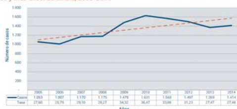
Figura 11. Violencia contra el adulto mayor; casos y tasas por 100.000 habitantes de 60 y más años. Colombia, 2005-2014

Fuente: Instituto Nacional de Medicina Legal y Ciencias Forenses / Grupo Centro de Referencia Nacional sobre Violencia / Sistema de Información para el Análisis de la Violencia y la Accidentalidad en Colombia / Sistema de Información de Clínica y Odontología Forense / Sistema de Información Nacional de Estadísticas Indirectas. Tasas calculadas con base en las proyecciones de población DANE 2005-2020.